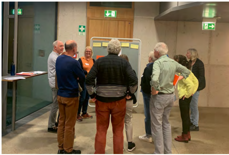
45 Menschen Citizen Science