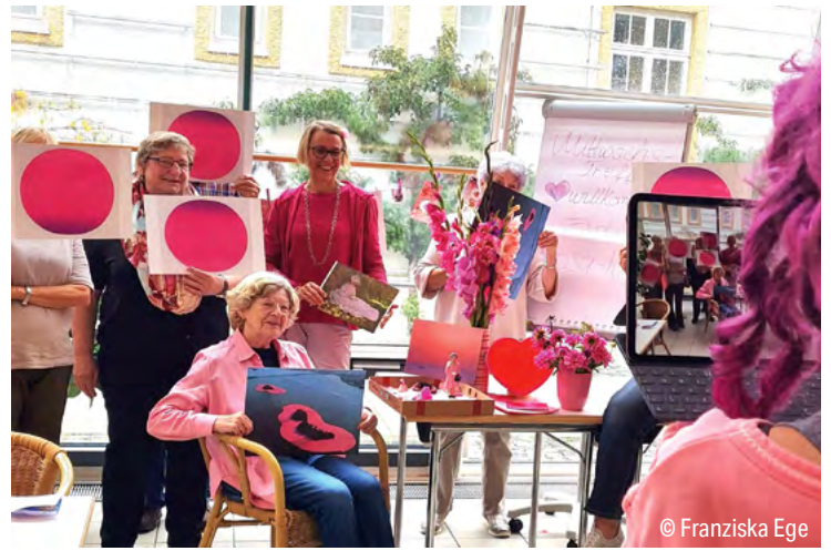
64 Bildung Kraft der Farben