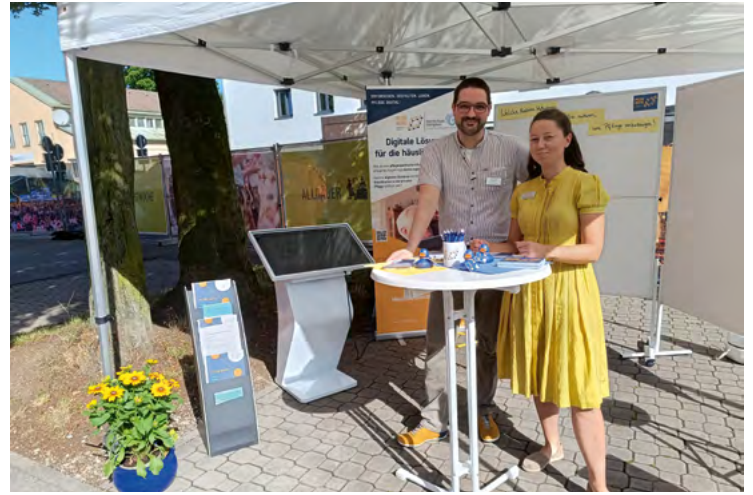
52 Forschung Projekt „Avocado“