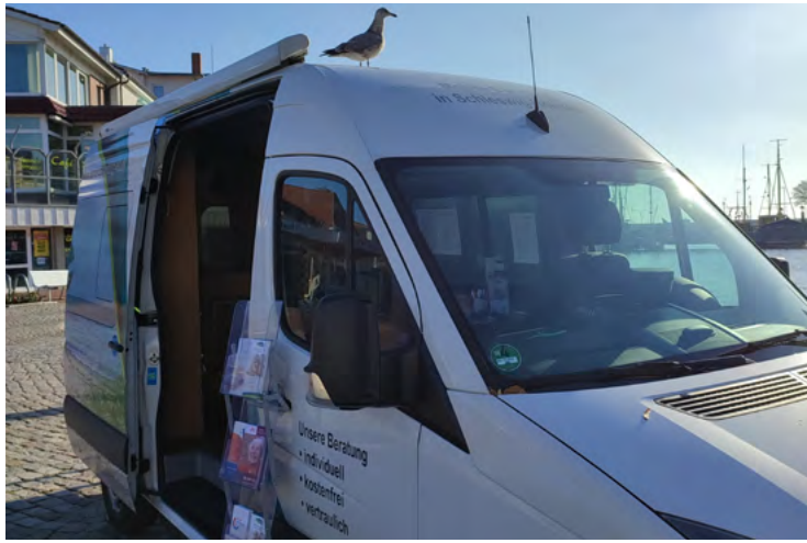
44 Management Beratungsmobil Demenz