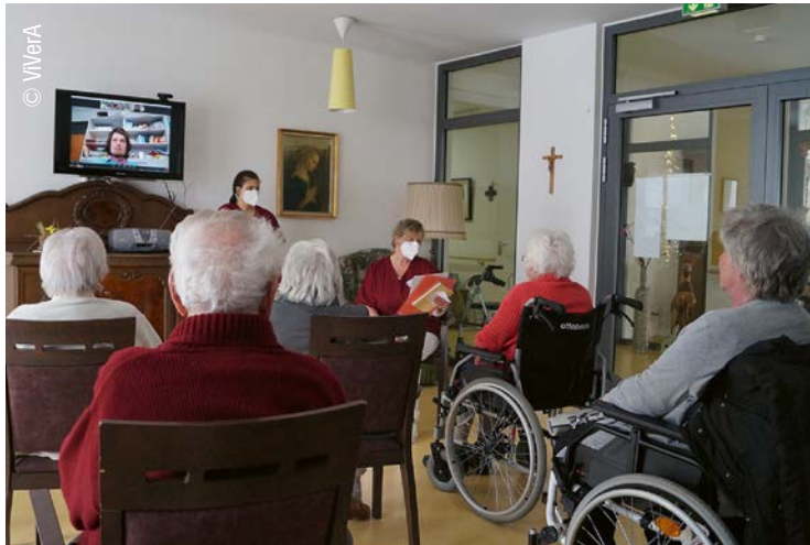
57 Management ViVerA – Virtuelle Veranstaltungen