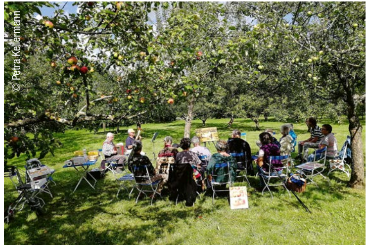
46 Menschen Kunst und Kultur in der Natur genießen