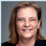
Sabine Weiss Parlamentarische Staatssekretärin, Bundesministerium für Gesundheit