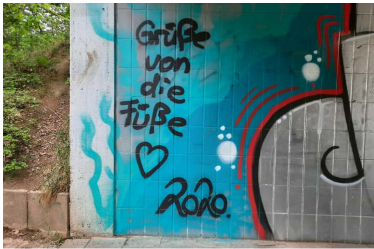
44 Leben Einladung zum Spaziergang