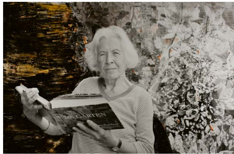
50 Menschen Die Ruhe vor dem Sturm