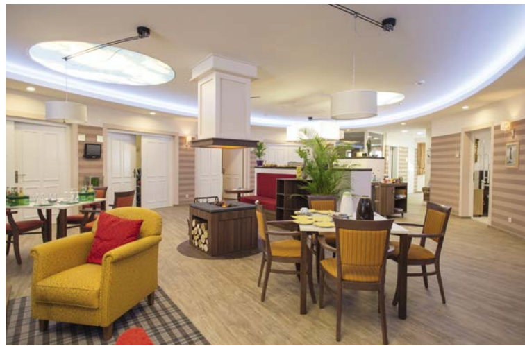
50 Management Pflegeoase Zwickau