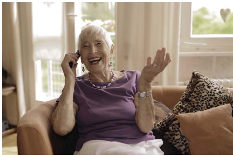
34 Leben Das Silbertelefon von Silbernetz e. V.